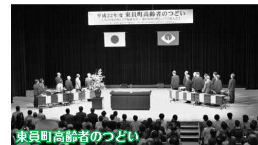
東員町高齢者のつどい