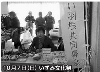
10月7日(日) いずみ文化祭