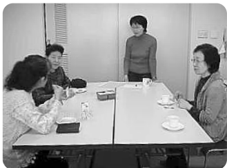
▲おしゃべり会の風景

今年度は「オムツ教室」「季節の野菜を使った料理教室」「ボディマッサージ」「ぶらり桑名」「施設見学」を開催しました。毎回恒例の「おしゃべり会」では、介護疲れにならないコツなど話し合いました。