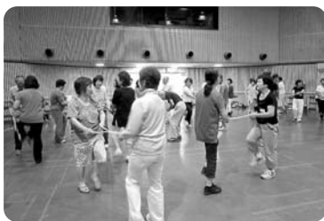
▲8月「笑いながらする、なごみ体操」

来年度についても、今年の参加者からご意見をいただき企画しました。4月に募集予定です。どうぞご応募ください。