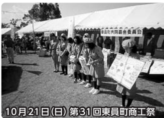
10月21日(日) 第31回東員町商工祭