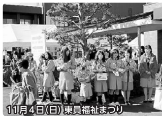
11月4日(日) 東員福祉まつり