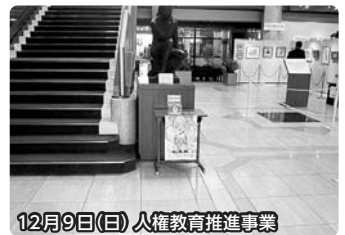
12月9日(日) 人権教育推進事業