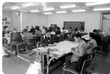
▲11月「来年度の教室をプログラムしよう」