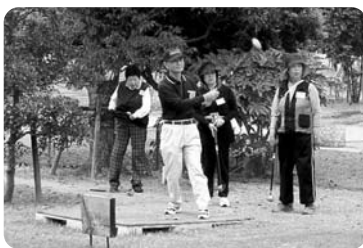
▲9月「グランドゴルフ」