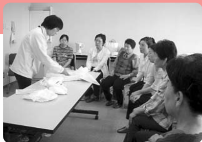
▲講師からおむつの当て方を学びました。