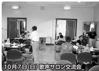
10月7日(日) 歌声サロン交流会