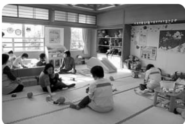
▲ボランティアの皆さんによる託児風景