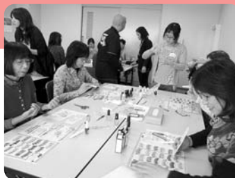
▲楽しいひとときです。