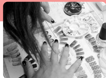
▲艶やかなネイルの色