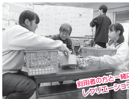
利用者の方と一緒に レクリエーションに参加