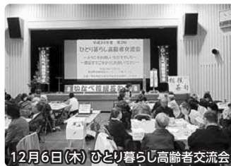
12月6日(木) ひとり暮らし高齢者交流会