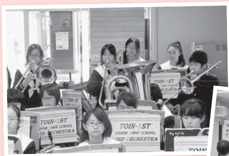
東員第一中学校 ブラスバンド部の 演奏風景

平成24年11月27日に東員第一中学校 ブラスバンド部が「デイサービスセンターふれあい」で演奏をしてくださいました。利用者の方も迫力ある演奏に圧倒されながらも、聞き覚えのある曲は口ずさんでいました。中学生の元気をもらい、少し、若返った気持ちになりました。