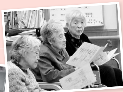
利用者の方も演奏に 聞き惚れました