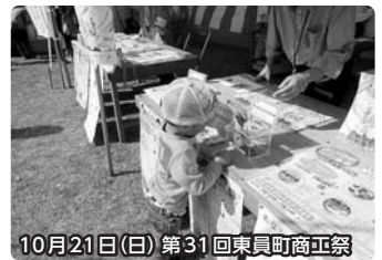
10月21日(日) 第31回東員町商工祭