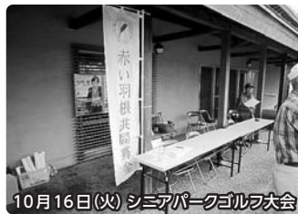
10月16日(火) シニアパークゴルフ大会