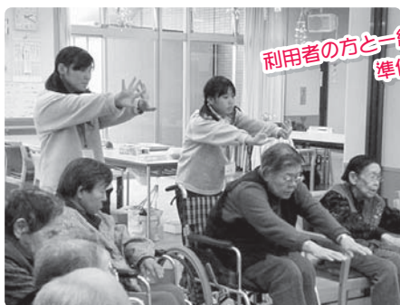
利用者の方と一緒に 準備体操

11月6・7・8日、東員第二中学校の2年生がデイサービスの勤労体験学習に来てくれました。最初は緊張していましたが、少しずつ笑顔が見られるようになり、最後は、一緒にレクリエーションを楽しんでもらいました。この体験が、将来の職業選択の一途となればと思います。