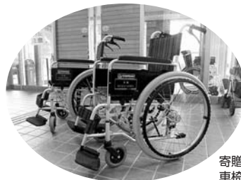
寄贈していただいた車椅子(2台)