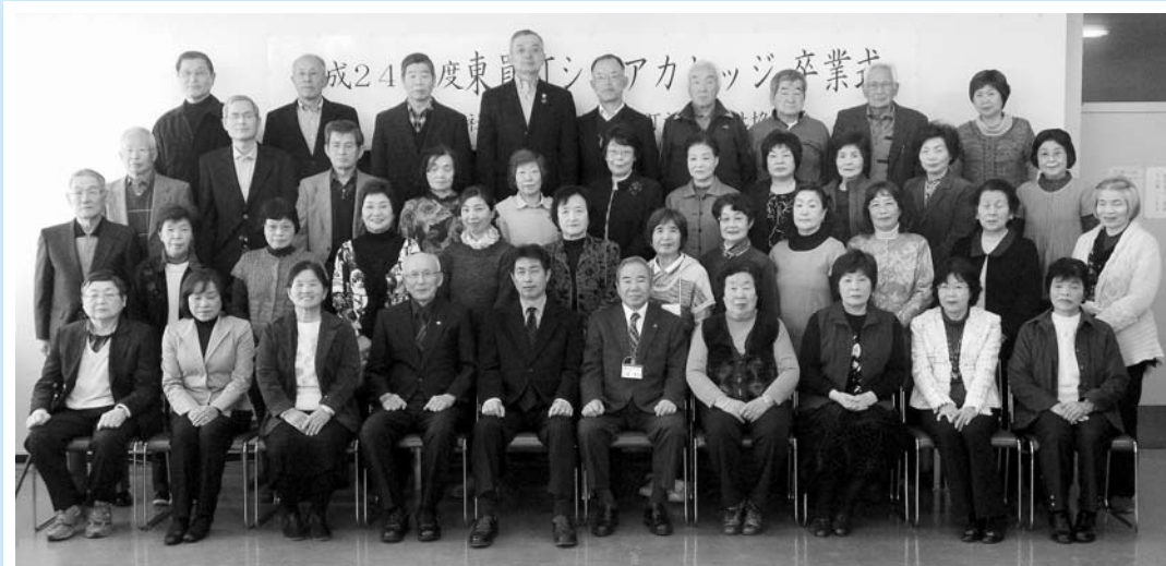
第37期 シニアカレッジ 教養学部 卒業生

平成24年度(第37期)東員町シニアカレッジ教養学部41名の方が卒業されました。今後は、ここで学んだ知識を生かし、地域で活躍されることを期待しています。