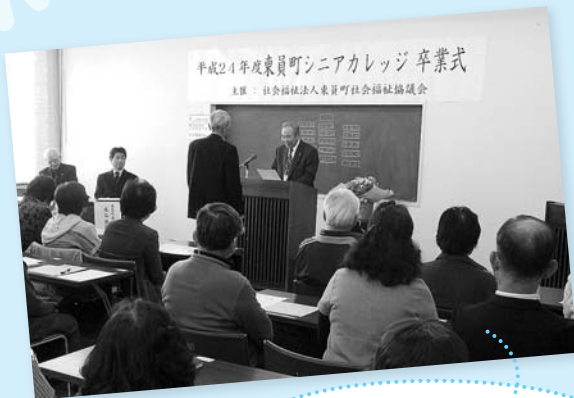
修了証書授与式の様子