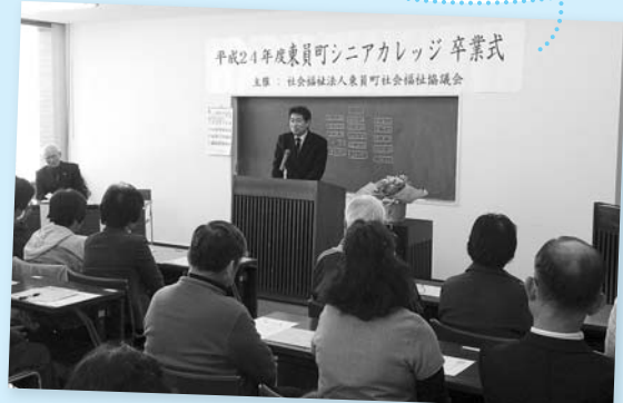
水谷町長からお祝いの言葉をいただきました

今年度の募集要項はP4・5にあります。 東員町のことをもっと知りたい方、少し時間ができて地域デビューを考えている方、ぜひ、ご参加ください。