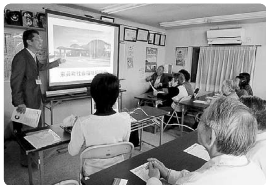
社会福祉協議会についての説明の様子

今後も、社会福祉協議会の取り組みや介護、介護予防、在宅福祉サービスなどについての説明会を地域へ出かけて実施させていただきましますので、是非とも、お声掛けをよろしくお願いいたします。