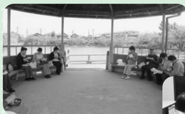
◀「ぶらり桑名」 おしゃべりをしながら お食事会!