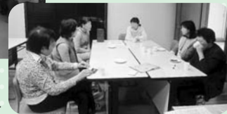
おしゃべり会の風景▶