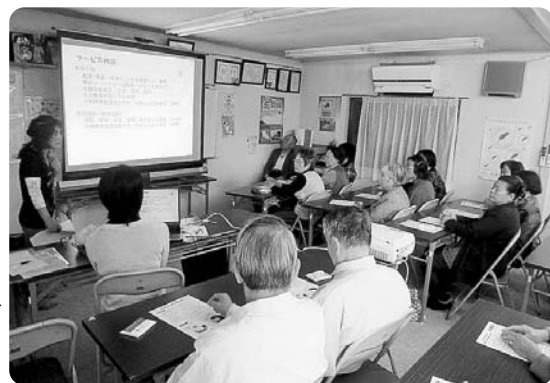
事業所管理者によるヘルパーの取り組みについて説明