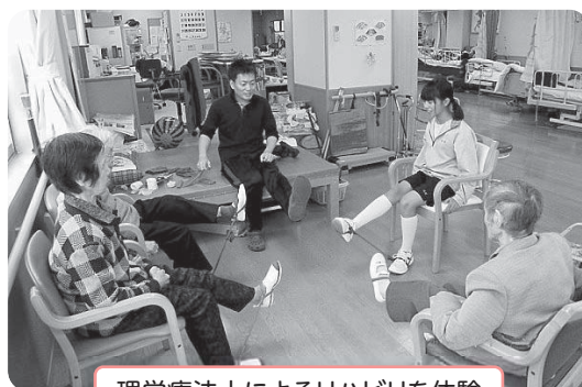
理学療法士によるリハビリを体験

平成25年11月6・7・8日、東員第二中学校の2年生が「デイサービスセンターふれあい」で勤労体験学習を行いました。1日目は緊張で利用者の方と話すことができなりましたが、徐々に慣れてきて、3日目には笑顔で“あいさつ”ができるようになりました。