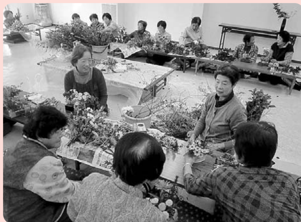
▲今回は生け花教室です。上手に出来上がりました