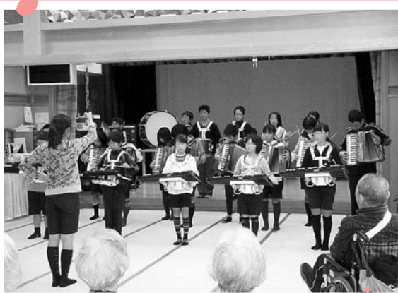
三和小学校伝統の鼓笛演奏