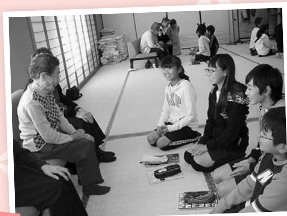
昔の話を真剣に聞いています

平成25年11月22日、三和小学校6年生が総合型介護予防事業のいきいきサロンに来てくれました。各班に分かれて昔の遊びや戦争の話を聞いたあと、合唱と三和小学校伝統の鼓笛演奏を披露してもらいました。すばらしい演奏に感動の涙を流している利用者の方もおり、楽しいひとときを過ごすことができました。