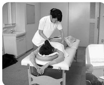
◀マッサージは癒しの時間です!

介護に役立つ情報や介護者リフレッシュ会の案内をお届けします。詳細は当会までお問い合わせください。