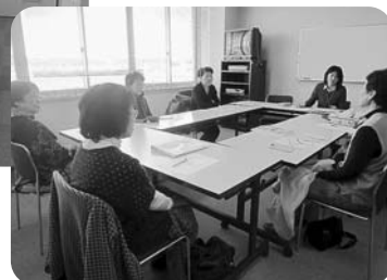
冬の健康管理を学びました。▶