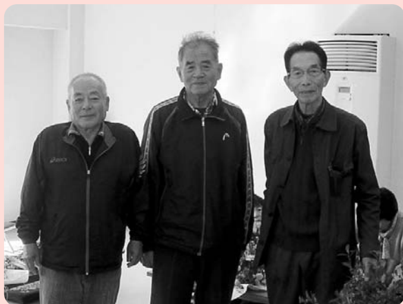
▲実行委員の皆さん

北大社百歳サロンは「百歳まで地域で元気に暮らそう」を目的に、毎月1回、第2金曜日午前10時から午後2時まで北大社構造改善センターで開催されています。参加者の平均年齢は約80歳！！近所の方が声を掛け合い毎回35名位の方が参加しています。午前中は様々な催しがあり、女性実行委員さんによる手作り昼食を食べて一日楽しく過ごしています。このような取り組みを通して、地域の“絆”を深めています。