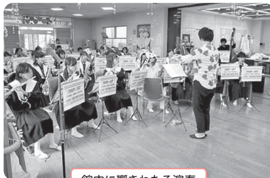
館内に響きわたる演奏

平成25年10月26日、東員第一中学校ブラスバンド部が「デイサービスセンターふれあい」で演奏会を行いました。演奏した曲は「あまちゃん」のテーマ曲やアニメソングなど聞き覚えのある曲がたくさんありました。利用者の方もこの“演奏会”を聞き元気をもらいました。