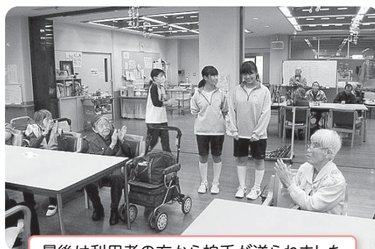
最後は利用者の方から拍手が送られました