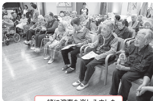
一緒に演奏も楽しみました