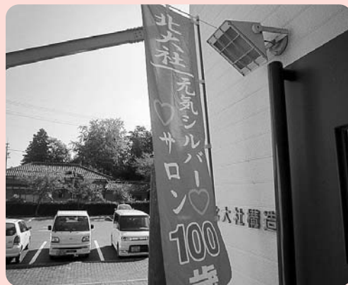
▲開催日にはのぼりが立ちます

北大社百歳サロンは「百歳まで地域で元気に暮らそう」を目的に、毎月1回、第2金曜日午前10時から午後2時まで北大社構造改善センターで開催されています。参加者の平均年齢は約80歳！！近所の方が声を掛け合い毎回35名位の方が参加しています。午前中は様々な催しがあり、女性実行委員さんによる手作り昼食を食べて一日楽しく過ごしています。このような取り組みを通して、地域の“絆”を深めています。