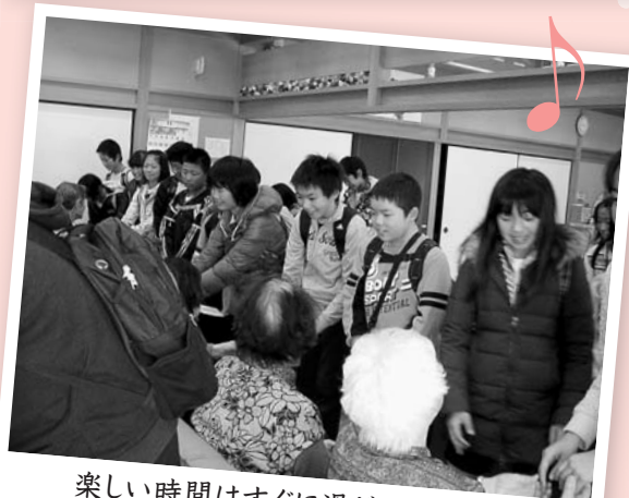
楽しい時間はすぐに過ぎてしまいます