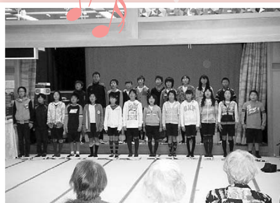
一緒に歌っている利用者さんもありました