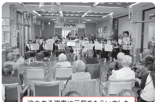
迫力ある演奏に元気をもらいました