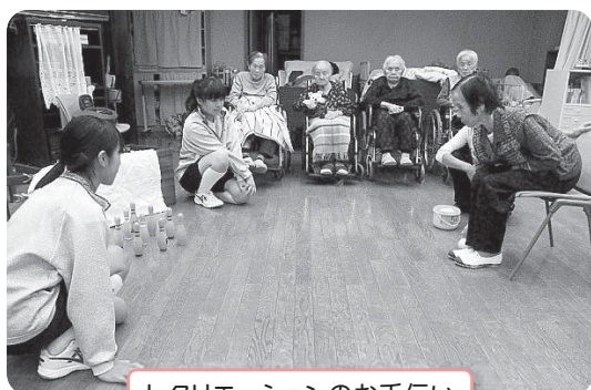
レクリエーションのお手伝い