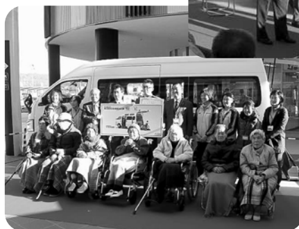
みんなで記念撮影