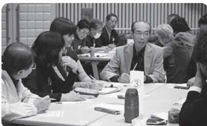
▲福祉のつどい 座談会