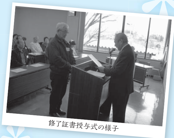
修了証書授与式の様子

今年の募集要項はP4~5にあります。東員町の福祉について学びたい方・定年後何をしようか悩んでいる方・地域デビューを考えている方など、是非、一緒の教室で学んでみませんか。