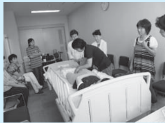
▲いろいろなケースでの対処法を学びました。

内容 おむつの使用に迷っている人、おむつのトラブルが心配な人。排泄に関するさまざまな悩みや質問に、介護のプロがお答えします。実践を通じておむつ交換のコツをマスターしましょう。