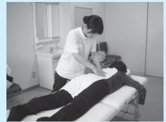
▲心も身体もリフレッシュ!!