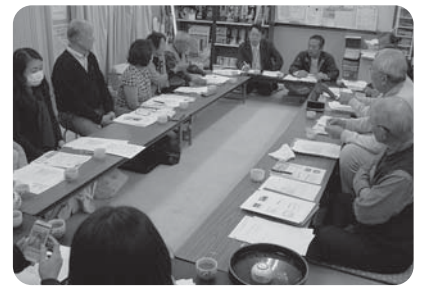
支えあい・助けあい活動の一環として 地域福祉座談会を開催しています

社協戸別会費 …………… 2,897,338円 日本赤十字社社費 …………… 2,886,955円 (内 東員町分区交付金) …… 523,552円