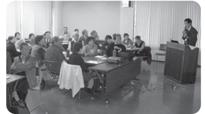
シニアカレッジは福祉活動のリーダーを 養成しています