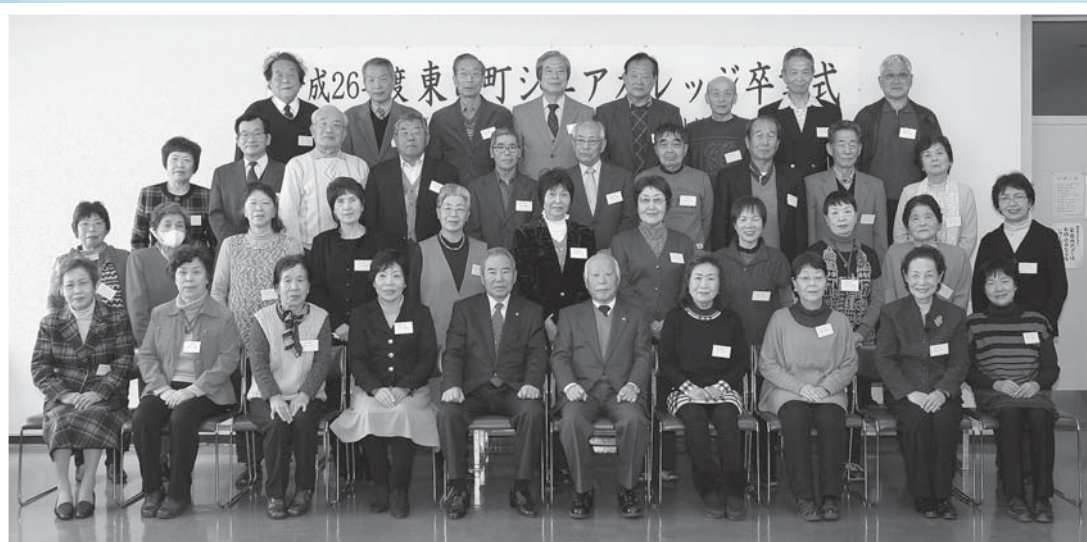
第39期シニアカレッジ教養学部卒業生

平成26年度(第39期)東員町シニアカレッジ教養学部37名の方が卒業されました。ここで学んだ地域福祉の取り組み内容を活かし、地域のリーダーとして活躍されることを期待しています。