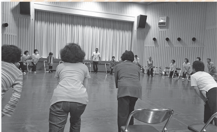
6月の講座 筋トレを行っている様子です

健康塾にはおおむね60歳以上の方で健康増進・介護予防に関心のある方に参加いただいています。いつまでも健康でいられるよう各種講座で学び、また受講生が介護予防意識を地域で普及啓発することを目的としています。今年で8年目を迎え、多くの受講生の方に参加いただき、たいへん好評の講座です。5月はヘルパーの仕事について学びました。6月はすきま時間を活用した筋トレを行いました。7月は傾聴について、8月は口腔ケアについて学びました。今後も体を動かしたり頭を動かしたりする講座が揃っていて楽しみです。