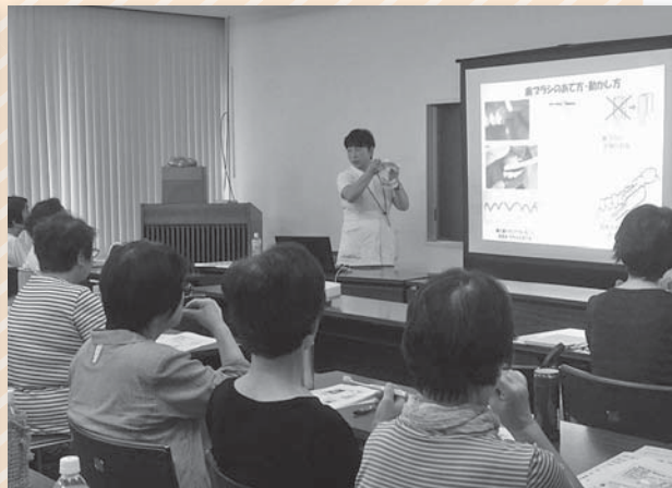
口腔ケアについて学んでいます