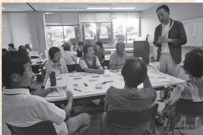
第4回目の講座です 東員町の魅力について皆で話し合いました