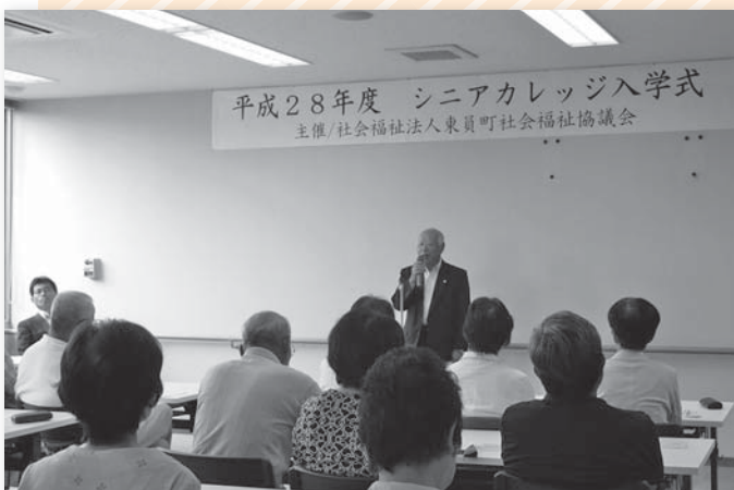
入学式の様子です

今回で41年目を迎える伝統あるシニアカレッジを今年度も開催しています。6月の入学式以降、月に1回様々な分野の講座を受けています。前半は町の現状や議会のしくみについて学んできました。今後は体を動かす体育の時間や、楽しい修学旅行の時間も待っています。入学式の時は顔も名前も知らない方同士でしたが、講義やグループワークを通して少しずつ打ち解けてきています。このシニアカレッジを通して地域に関心を持ってもらったり、他の方との交流が増えると嬉しいです。