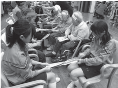
↑レクリエーションと一緒に取り組む様子

初日は緊張感がなかなか取れず硬い表情でしたが、利用者の方々と接しているうちに徐々に緊張もほぐれ、笑顔も増えていきました。一緒に運動をしたり、ゲームをしたり、入浴のお手伝いをしたり、3日間でたくさんの経験をしました。