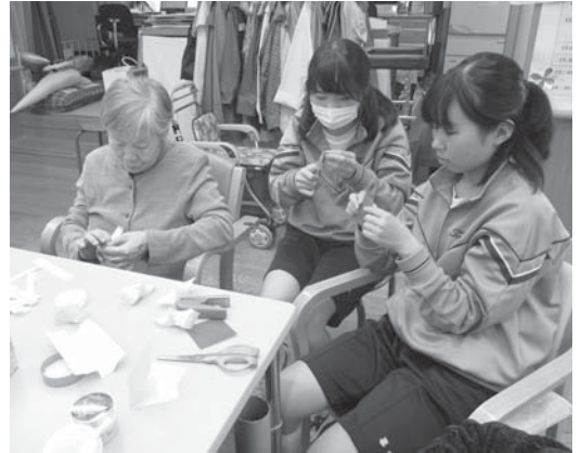
↑折り紙を使った制作物を手伝ってもらっています

働くことの素晴らしさ、喜び、厳しさを身をもって実感し、「働くとは何か」について真剣に考えるきっかけとなれば嬉しいです。