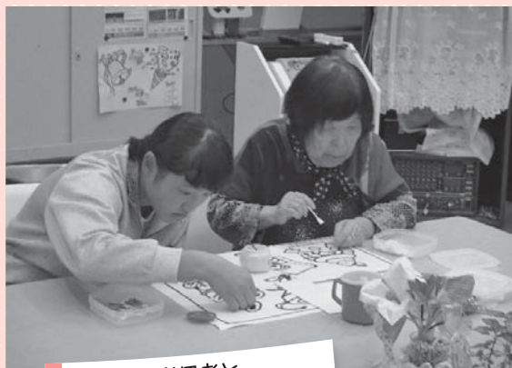
貼り絵を利用者と一緒に取り組んでいます。

介護や福祉の仕事に関心のある方はいつでも見学やボランティアを受け付けています。詳しくは東員町社会福祉協議会までお問い合わせください。