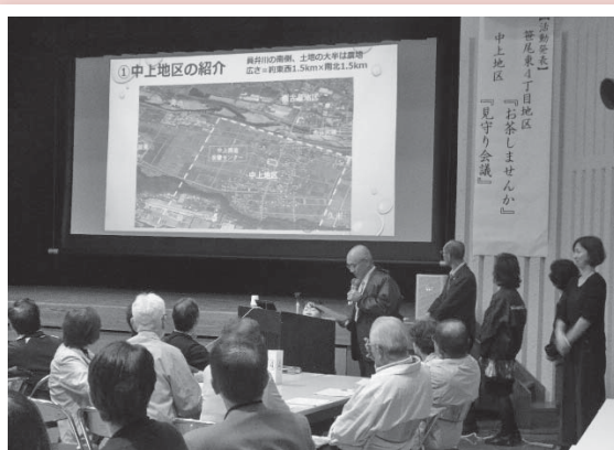
中上地区の発表の様子です