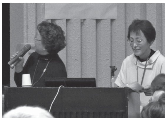
笹尾東4丁目地区の発表の様子です

はじめに、笹尾東4丁目地区、中上地区に活動発表をお願いしました。笹尾東4丁目地区は、地域の人が気軽に集まれる居場所『お茶しませんか』について、中上地区は、中上地区を良くしていこうと話し合っている『中上地区見守り会議』について発表していただきました。