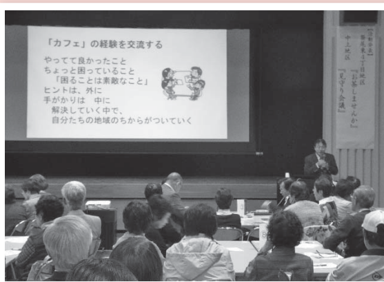
木全教授の講演の様子です