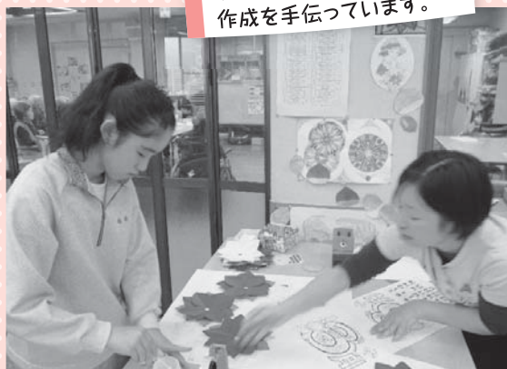
クリスマス用の飾り作成を手伝っています。