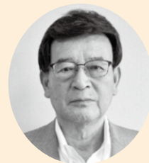
東員町共同募金委員会 会長